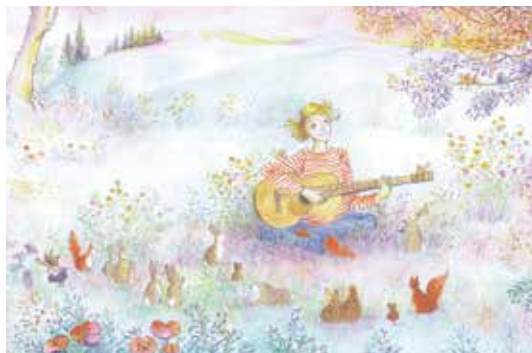
【いばらひめ】2007 BL 出版