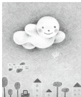
『くもくん』1998 ポプラ社