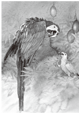
「森からのよびごえ」2014 BL出版

親しい友人同士でもあるお二人の作品の、花や人形にいろいろとられた華やかな世界をお楽しみください。