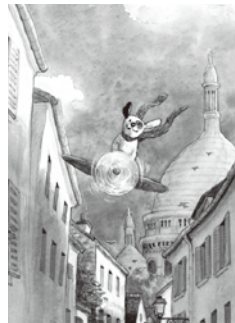
「とんでいきたいなあ」2010 BL出版