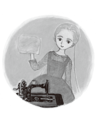
「ミシンのうた」2014 講談社