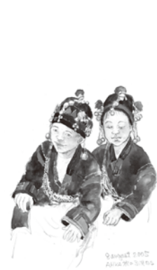
ラオスの民族衣装のスケッチ 2005