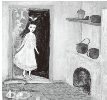
「しらゆきひめ」2001 教育画劇