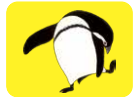
『ペンギんたいそう』2013 福音館書店