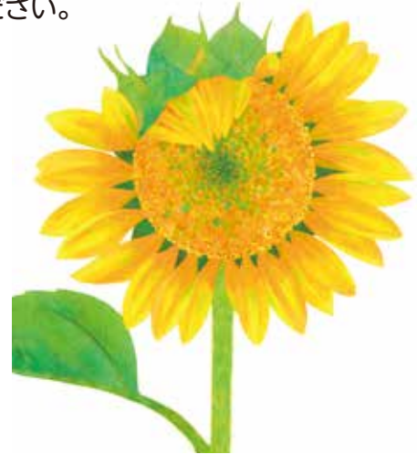
『さくよ さくよ』2016 福音館書店