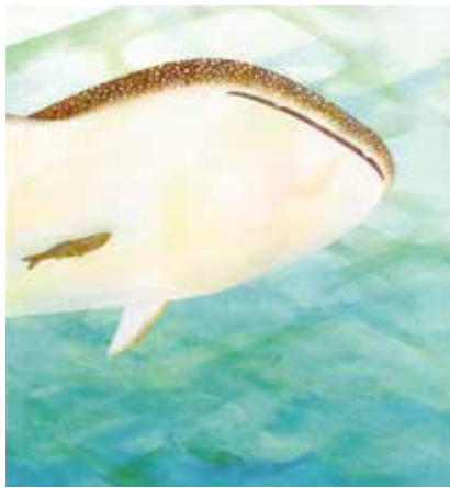
『すいぞくかんのおいしゃさん』2018 福音館書店