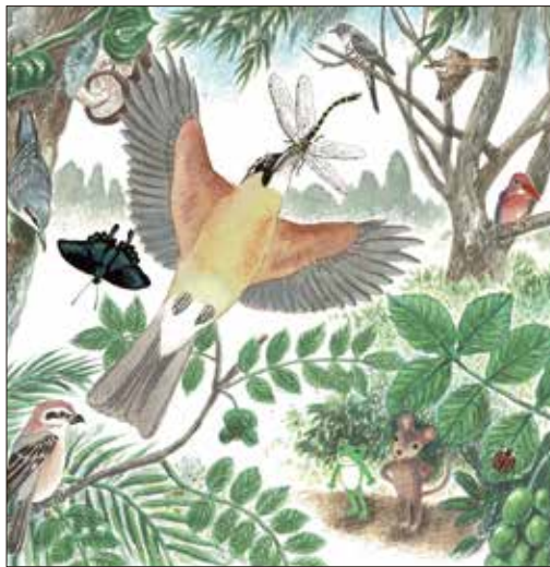
『カエルくんのだいはっけん!』2016年 小学館