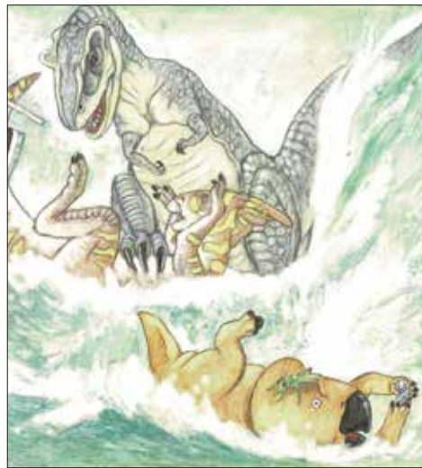
『だんごむしと恐竜のレプトぼうや』2003年 小学館