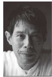
五味太郎 Gomi Taro

五味さんは1973年に絵本作家としてデビューして以来、子どもの目線に寄り添った作品を数多く出版しています。子どもには絵本を読む楽しさを、大人には忘れていた子ども心の再発見をもたらしてくれます。絵本原画、国内外で出版された絵本を展示するコーナーなど五味さんの世界を堪能できる内容です。五味太郎ワールドをお楽しみください。