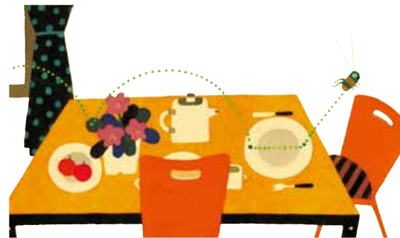
『ぼったくん』 1984 福音館書店

※絵本原画とあわせて、アニメーションを上映いたします。このほか、製作風景なども上映いたします。 ※展示内容は、都合により変更する場合がありますので、ご了承ください。