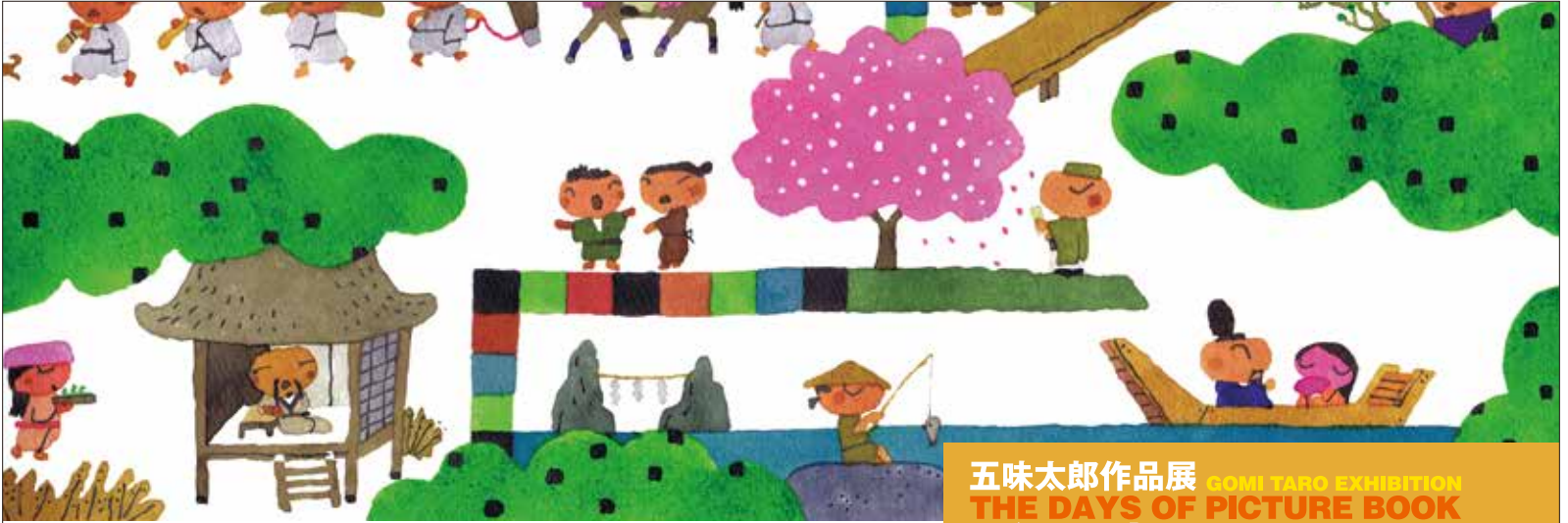
『百人一首ワンダーランド』2014 東京書籍