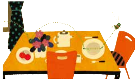
『ぼったくん』1984 福音館書店