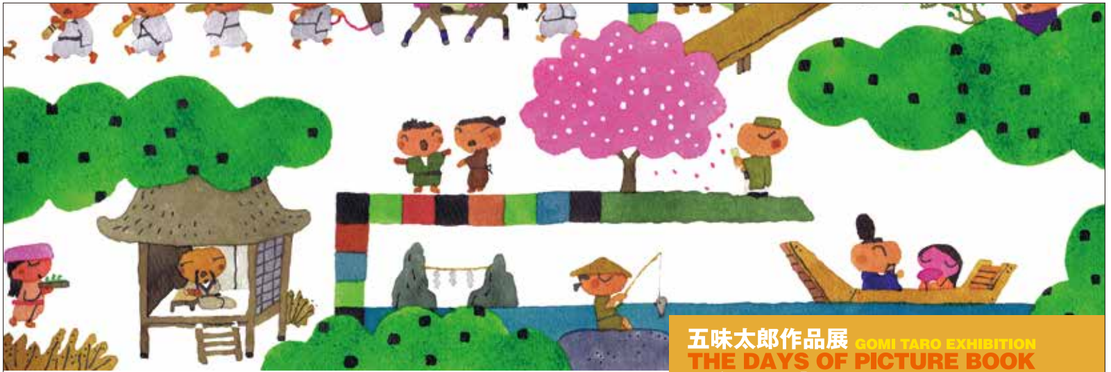
『百人一首ワンダーランド』2014 東京書籍

五味太郎作品展 GOMI TARO EXHIBITION THE DAYS OF PICTURE BOOK