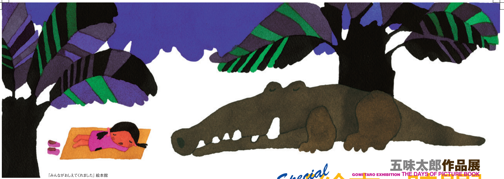
『みんながおしえてくれました』絵本館