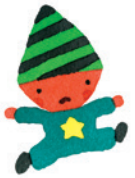
『ゲーム・ブック No.1』借成社

【表面イラスト】左上より… 『みんながおしえてくれました』絵本館 『いました』プロンズ新社 『きんぎょが にげた』福音館書店 『ぐりぐりくん』絵本館 『グレート・ワンダーシップへようこそ!』借成社 『ゲーム・ブック No.1』借成社 ©GOMI TARO