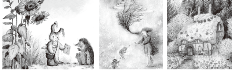
左から…『いばらひめ』2007 BL出版 / 『ハネスうさぎは ゆうびんやさん』1999 講談社 / 『雪の女王』1986 西村書店 / 『ヘンゼルとグレーテルのおはなし』2006 BL出版 ©Bernadette Watts

イギリス在住の絵本作家、バーナデット・ワッツは、現代イギリスを代表する絵本作家の一人です。世界的な絵本作家であるブライアン・ワイルドスミスに師事し、『野の白鳥』『ヘンゼルとグレーテル』など主にアンデルセンやグリムの古典を題材として数多くの絵本を生み出しました。これらの作品はヨーロッパをはじめアジア各国で出版され、日本でもそのクラシカルで繊細な作風はとて高い評価を受けています。