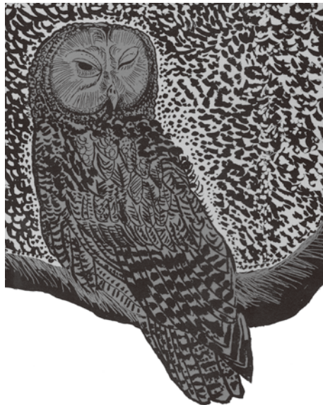
宮沢賢治「旭川。」より 2016 BL出版