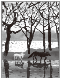
『しろいやみのはてで』2004 講談社