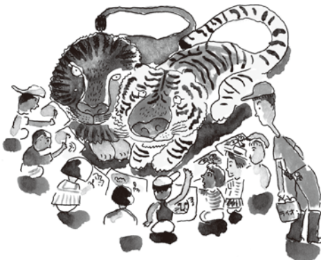
『どうぶつえん物語』1994 絵本館