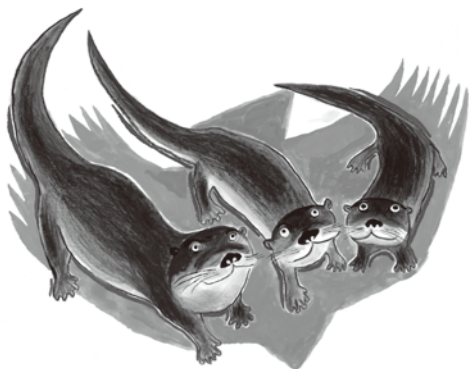
『かわうそ3きょうだい そらをゆく』2013 小峰書店

あべさんが描くユーモアあふれる動物たちをどうぞお楽しみ下さい。きっと、多くの人が動物をより好きになるはず。